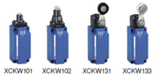
XCKW101 XCKW102 XCKW131 XCKW133