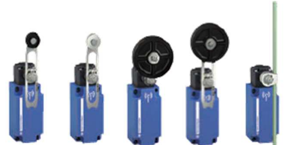
XCKW141 XCKW143 XCKW139 XCKW149 XCKW159